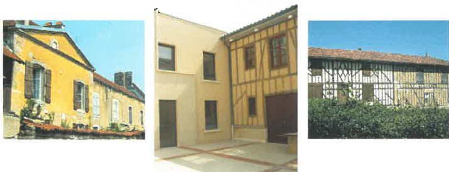
Enduits (réf. RDS)